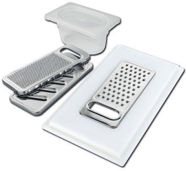
Kit rallador con soporte para anillo y bandeja de recogida de alimentos